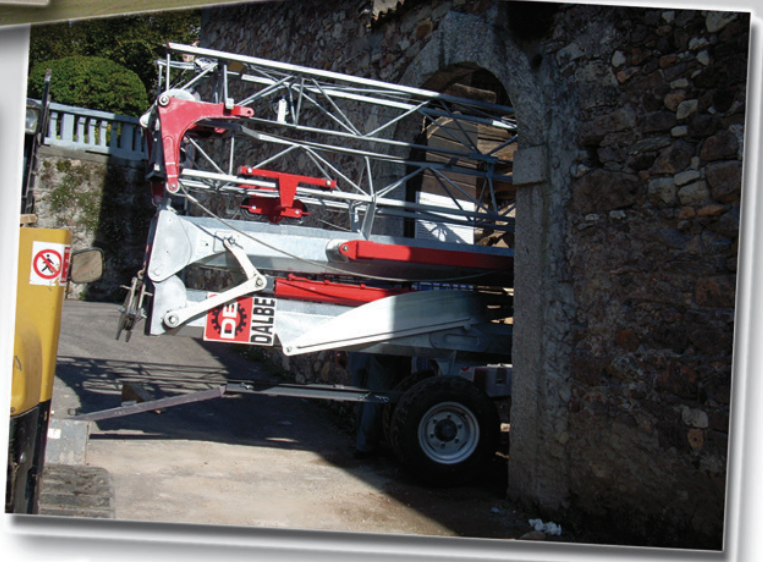
Compact overall dimensions