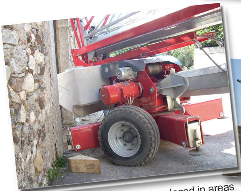
DSS system: the crane can be placed in areas with very narrow access